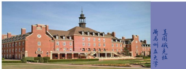
美国俄克拉荷马州立大学